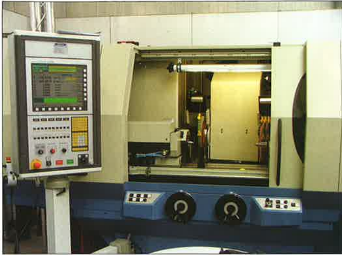
Konventionelle und CNC-Technik in einer Maschine: die revolutionäre WUG 21 von Weiss

nenverkleidung aufgebaut. Lager, Spindeln und Antriebe entsprechen dem heutigen Stand der Technik und sind mit aktuellen Neumaschinen durchaus vergleichbar. Darüber hinaus offeriert Weiss die Überholung einzelner Baugruppen, einen umfangreichen Service, Unterstüt-