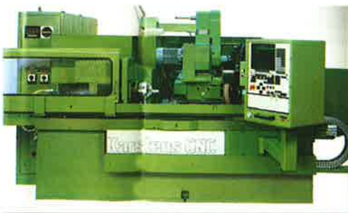
Universalsrundschleifmaschinen K 11 / K 23