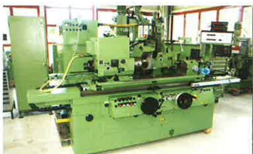
CNC-Rundschleifmaschinen K26 / K27 / K28 K33 / K37 / K51 / K53 / K56

Service, Betreuung für Ihre Karstens Rundschleifmaschinen von Bj. 1970 - 1998