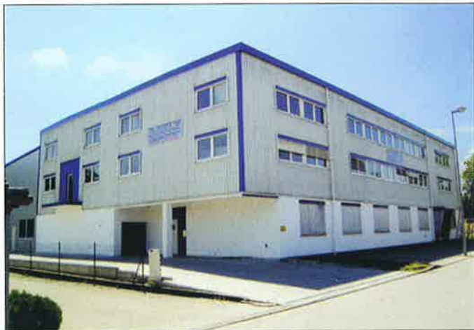
Denkfabrik für das industrielle Rundschleifen: das 2008 bezogene Firmengebäude der CNC-Technik Weiss GmbH in Neckartailfingen

Die in Neckartailfingen beheimatete CNC-Technik Weiss GmbH gilt in Fachkreisen als erste Adresse für industrielles Rundschleifen. Neben innovativen Rundschleifmaschinen machen kompetente Beratung, exzellente Serviceleistungen, innovative Sonderlösungen, ein zuverlässiger Reparaturdienst und Schulungen Weiss zu einem Full Service-Partner in Sachen Rundschleifen.